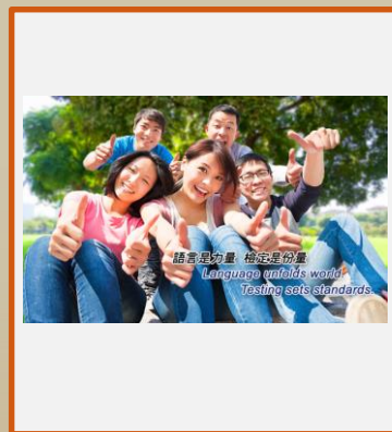
LTTC 全民英檢 (電腦使用)