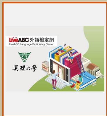
Live ABC 新多益、JLPT日檢 (手機/平板/電腦使用)