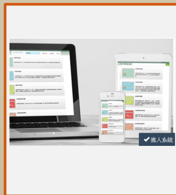
Easy Test 英文學習系統 (手機/平板/電腦使用)